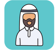
الاستاذ/ حامد حنيف الذيابي مستشار عضوا